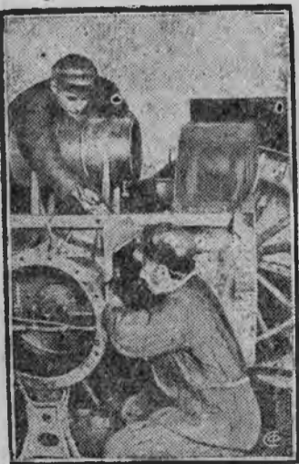
Ударники за ремонтом тракторов

В механической мастерской, как одной из важнейших отраслей совхозного хозяйства работа которой является решающей в проведении ремонтной кампании, куда должно быть сосредоточено максимум внимания со стороны дирекции партийно-комсомольской и профсоюзной организации, этого нет, производственные совещания не работают, красный уголок стоит закрытым, соревнования отсутствуют. Среди коллектива рабочих нет товарищеской спаянности и единения.